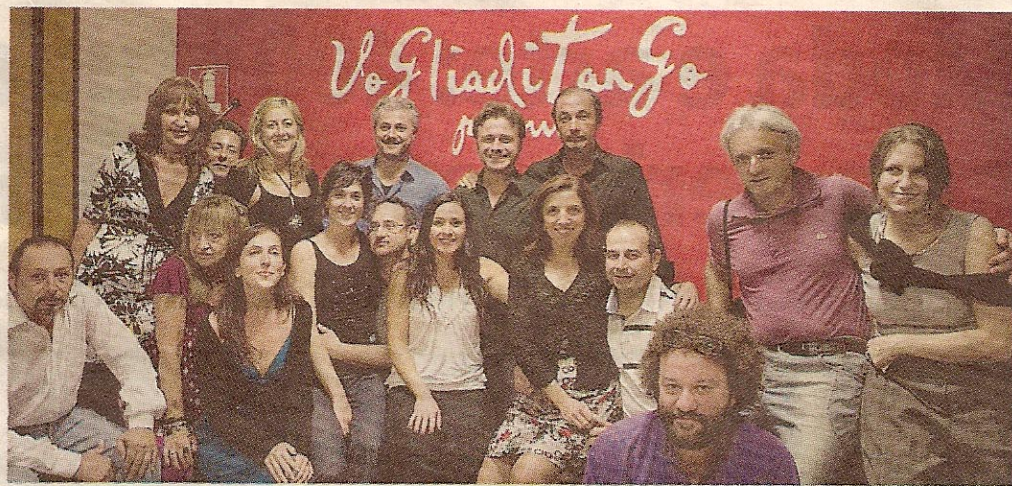
Tango che passione Alcuni momenti delle lezioni di tango e un gruppo di partecipanti a uno dei corsi per imparare il ballo argentino.